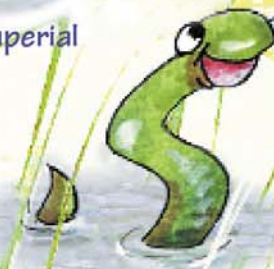
Gulebra de Agua