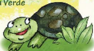
Tortuga (galápago europeo)